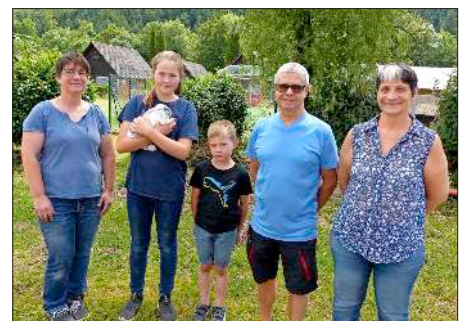
Frohe Gesichter fand man bei erfolgreichen Züchtern des C28 Denzlingen.

Bundesweites Aufsehen erregte eine TV-Dokumentation im Jahr 2011, bei der ein Fernsehteam den Leidensweg seiner Frau nach der Diagnose Bauchspeicheldrüsenkrebs bis zum Tod begleitete.