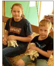
Spaß fanden die Kinder besonders im „Streichelzoo“.

Denzlingen (hg). Eine vereinsinterne Jungtierschau in Verbindung mit einer Jugend-Jungtierschau der Kreisverbände Freiburg und Emmendingen organisierte der Kleintierzuchtverein C28 Denzlingen am vergangenen Wochenende bereits zum dritten Mal.