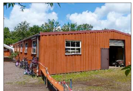
Die vereins eigene Ausstellungshalle mit Mehrzweckraum.

Gut bewirtet wurden die zahlreichen Besucher an beiden Ausstellungstagen. Für die Kinder war wieder ein kleiner Streichelzoo errichtet, der ebenfalls großen Zuspruch fand.