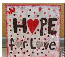
Ein kunsthandwerklich gelungenes Stück mit inhaltlicher Botschaft.