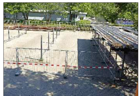
Die Dächer der Fahrradabstellplätze im Bildungszentrum werden erneuert.

Diesmal wird das alte Eternit-Dach auf dem Fahrrad-Abstellplatz entfernt und durch ein begrüntes Flachdach ersetzt. Derzeit sieht man nur noch die tragenden Metallstützen, die schon bald das neue Dach tragen werden.