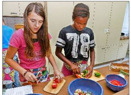
Schüler beim Koch-Workshop.