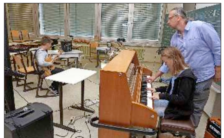
Auch die Musik kam bei den Workshops nicht zu kurz.

Bewährt habe sich die verbindliche Kombination der drei Komponenten „Lernshops“, „gemeinsames Mittagessen“ und der „Workshops“, für die sich die Teilnehmer zur verbindlichen Teilnahme verpflichteten. Insgesamt neun Lernbegleiter, nämlich Studierende der Hochschulen für Soziale Arbeit, der Pädagogischen Hochschule und der Universität, sorgten für einen motivierenden Ablauf des täglichen Angebotes, wobei sich die Schüler jeweils für ein Unterrichtsfach pro Woche (Mathematik, Deutsch, Englisch) anmeldeten. Wer zwei Wochen teilnahm, konnte daher maximal zwei unterschiedliche Unterrichtsfächer besuchen.